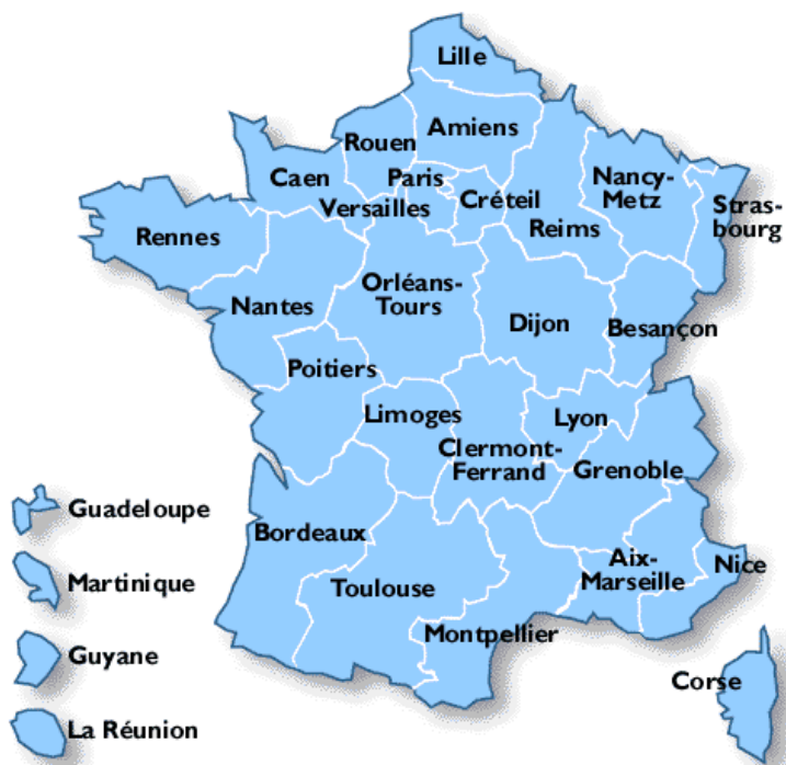
Karte der „Académies“ (Schulverwaltungsregion)