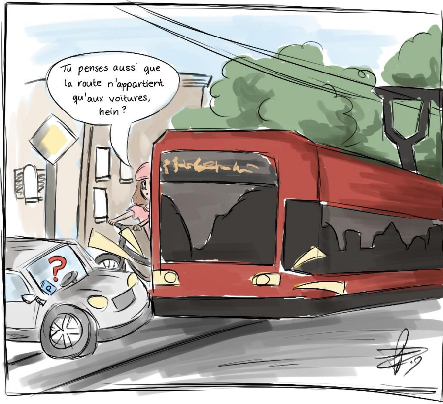
caricature illustré par Laura Noster