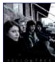
Yellowtree Indierock mit Post-rockgesten