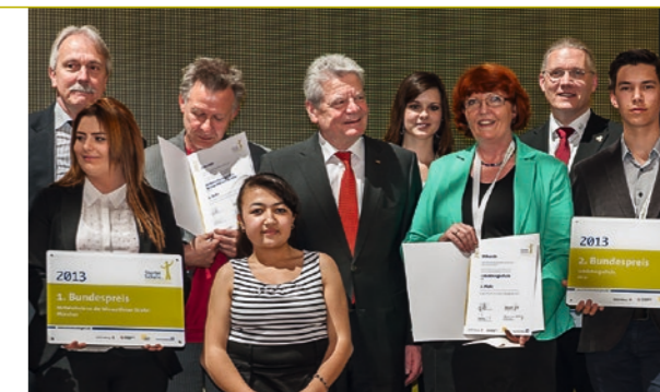
Bundespräsident Joachim Gauck gratulierte 2013 den „Stärksten Schulen“ Deutschlands.

Mit außerschulischen Partnern kooperieren